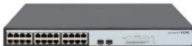
H3C MS4024 安防交换机正面图