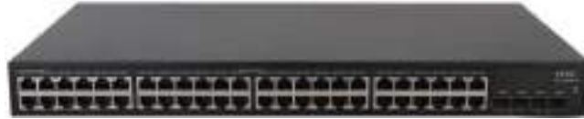
H3C MS4048 安防交换机正面图