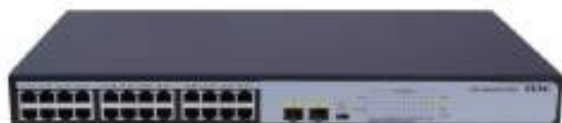
H3C MS4024P-PWR 安防交换机正面图