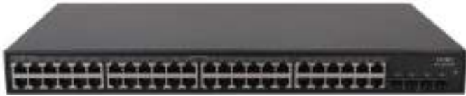
H3C MS4048P 安防交换机正面图