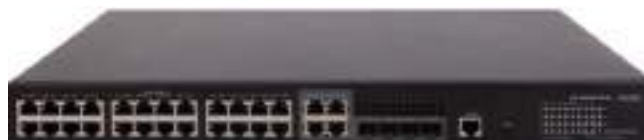
MS4320S-28P-PWR 安防交换机正面图