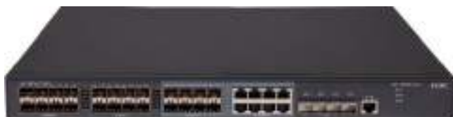
MS4320S-28F 安防交换机正面图