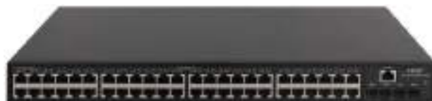
MS4300V2-52P 安防交换机正面图