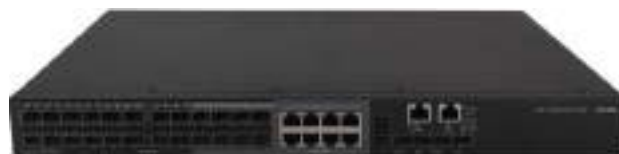
MS4320V2-28F 安防交换机正面图