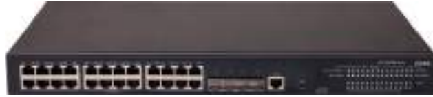
MS4320V2-28S-PWR 安防交换机正面图