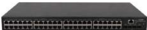
MS4320V2-52S 安防交换机正面图