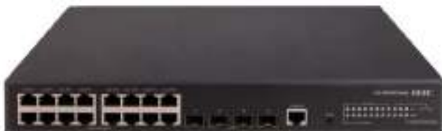
MS4320S-20P-PWR 安防交换机正面图