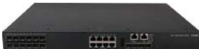
MS4520V2-24TP 安防交换机正面图