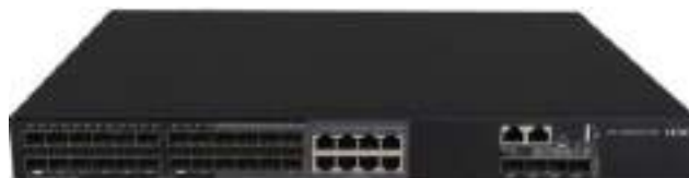
MS4520V2-30F 安防交换机正面图