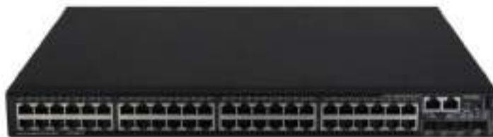
MS4520V2-54C 安防交换机正面图