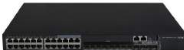
MS4520V2-30C 安防交换机正面图