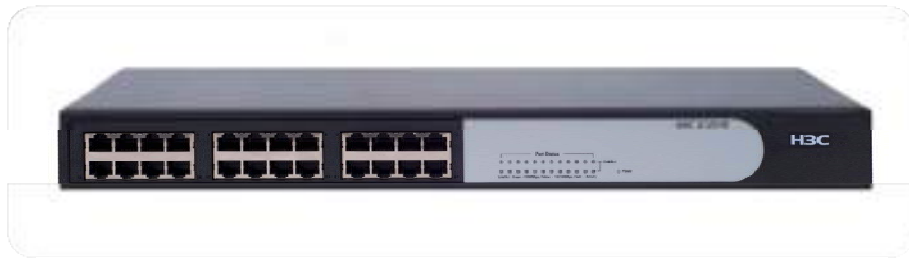
H3C S1224E 以太网交换机

H3C S1224E 是 H3C 公司自主开发的全千兆绿色节能无管理以太网交换产品，提供了 24 个 10/100/1000M 以太网端口，所有端口均支持全线速无阻塞交换以及端口自动翻转功能，外形采用 19 英寸钢壳标准机架设计。