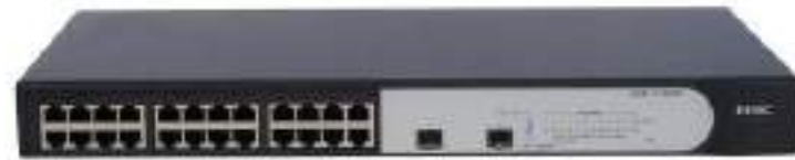
H3C S1324F 以太网交换机

H3C S1324F 是 H3C 公司自主开发的全千兆无管理以太网交换产品，提供了 24 个固定的 10/100/1000Base-T 自适应以太网端口（简称电口），2 个千兆 SFP 端口（简称光口），其中端口 12 和端口 24 为 Combo 口（即电口与其对应的光口是光电复用关系），同时实现了光口 12 和光口 24 之间的聚合，增加了带宽。同时，该两端口之间彼此动态备份，提高了连接可靠性，S1324F 外形采用 19 英寸钢壳标准机架设计。