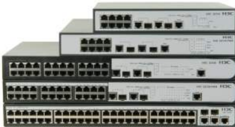
S2100 系列千兆上行交换机

H3C S2100 系列千兆上行交换机是杭州华三通信技术有限公司（以下简称 H3C 公司）面向接入推出的新一代百兆接入产品，丰富的安全特性为网络提供更精细化的接入控制，同时支持安全网管 SNMPv3、SSHv2，进一步提高了管理的安全性，增强的以太网供电功能(PoE+)使一些大功率设备可以通过以太网供电。