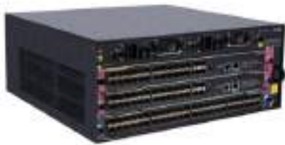
H3C S7003E 高端多业务路由交换机

H3C S7000E 产品是新华三技术有限公司（以下简称 H3C 公司）面向业务网络的高端多业务路由交换机，该产品基于 H3C 自主知识产权的 Comware V7 操作系统，以 IRF2（Intelligent Resilient Framework2，第二代智能弹性架构）为系统基石的虚拟化软件系统，支持 TRILL 和 MDC（一虚多）技术，进一步融合 MPLS VPN、IPv6 等多种网络业务，提供不间断转发、不间断升级、优雅重启、环网保护等多种高可靠技术，在提高用户生产效率的同时，保证了网络最大正常运行时间，从而降低了客户的总拥有成本（TCO）。H3C S7000E 可配备双主控双电源，并且符合“限制电子设备有害物质标准（RoHS）”，是绿色环保的路由交换机。