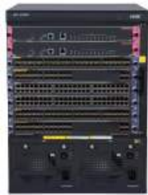
H3C S7006E 高端多业务路由交换机