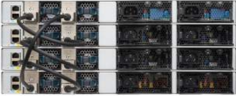
图 4. 思科 Catalyst 9200 系列交换机堆叠设备