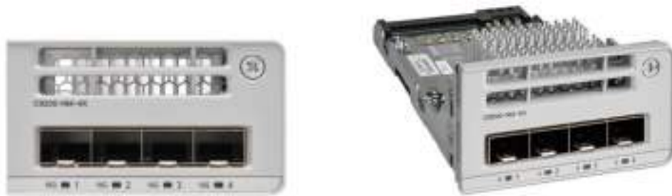
图 2. 思科 Catalyst 9200 系列交换机网络模块

思科 Catalyst 9200 系列交换机配备模块化或非模块化上行链路，如表 1 所示。模块化 SKU 的现场可更换网络模块支持从 1G 无中断迁移到 10G 及更高规格，因此可为您的基础设施投资提供投资保护。在购买交换机时，您可以选择表 2 中列出的网络模块。