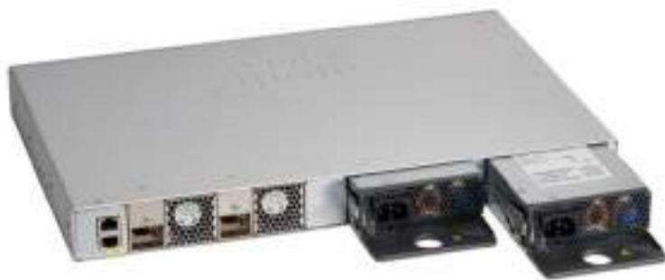
图 3. 思科 Catalyst 9200 系列交换机双冗余电源